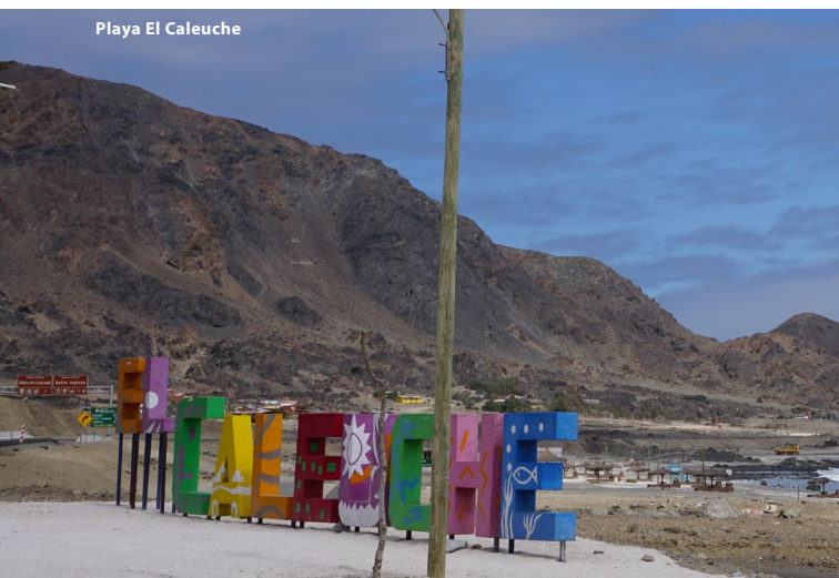
Playa El Caleuche

◊ El Sector Precordillerano , con alturas que varían entre los 3.000 y 4.500 m.s.n.m. Hacia el sur forma la Cordillera de Domeyko, la cual se va desmembrando en un conjunto de sierras que se emplazan de forma cada vez más transversal, impidiendo el desarrollo longitudinal de la depresión intermedia.