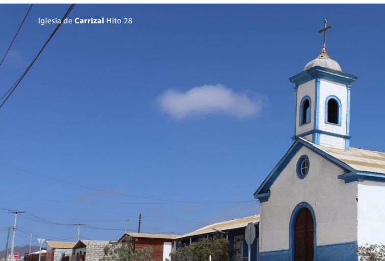
Iglesia de Carrizal Hito 28