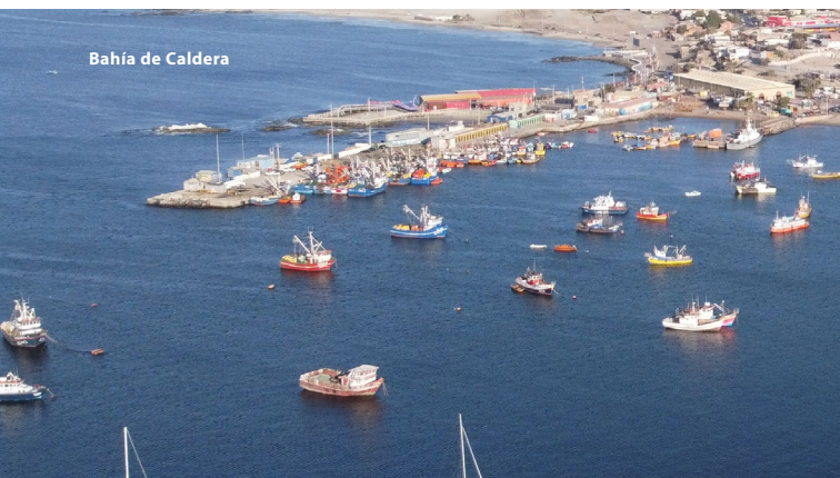
Bahía de Caldera

En el caso de la región de Atacama, los incas habrían puesto su interés específicamente en el valle de Copiapó, apreciando su gran potencial minero y la evidente posición estratégica para establecer la dominación en la zona y luego extenderse hacia Chile central. La dominación del valle de Copiapó no habría sido