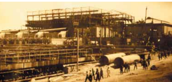
Construction of Pedro de Valdivia Office, 1931.

Chacabuco was the last Nitrate Office which used the "Shanks" production system. This office was also notable for its large size, production capacity (150,000 metric tons of nitrate and 92,200 kilograms of iodine a year) and the quality of its industrial insta-