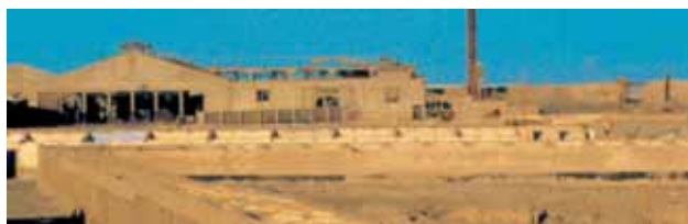
Cuartos de Solteros en el límite Oeste y Sur de Chacabuco.

casas, separadas por pasajes de 3 metros de ancho.