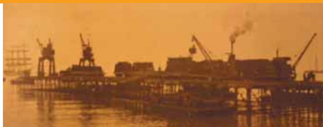
Mejillones Port's nitrate pier.