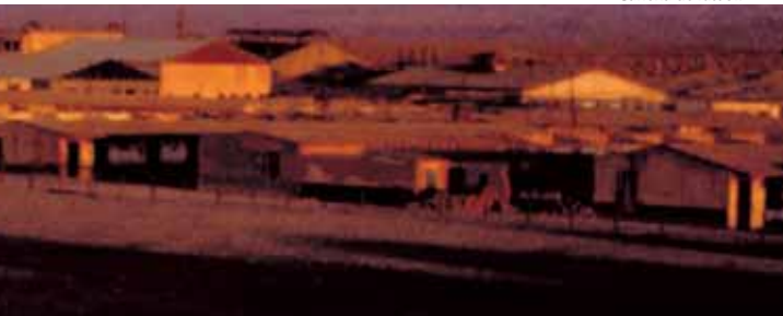
Cancha de fútbol.