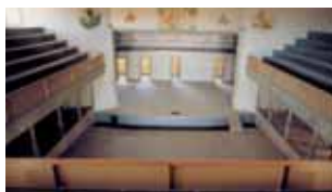
Teatro de Chacabuco en la actualidad.

La Plaza (0) es un cuadrado perfecto de 50 metros por lado, enmarcada en un espacio mayor de 100 x 100 metros. Constituía el centro de la Oficina Salitrera y fue concebida como área verde, de recreación y encuentro social. Contaba con un kiosco de retre-