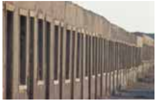
Single worker's quarters.

Heading West along Coquimbo Street to the end, you reach the boundary houses and find one of the Nitrate Office's entrances - currently blocked-, named trancas . The boundary houses were