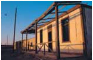
Current façade of the Chacabuco Hospital.

Now return to sign number 2 “Political Prisoners”. To the East, at the end of Antofagasta Street, stood the Hospital and Maternity Clinic (4) of the Chacabuco Nitrate Office. The same premises were used as a military hospital during the political prisoner’s internment.