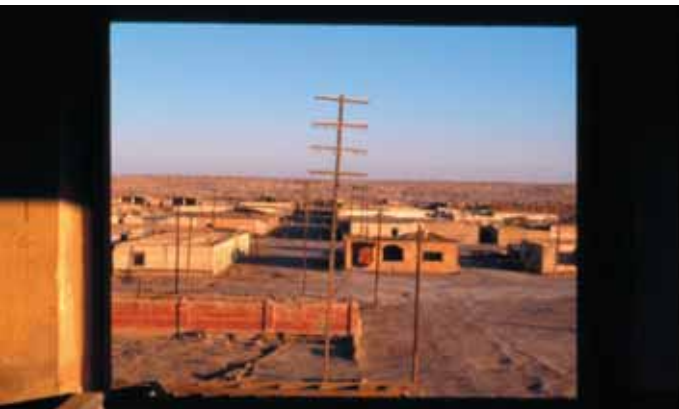
Vista desde el Teatro hacia el norte del Campamento.

En la esquina Noroeste de las calles Lynch y Antofagasta, de Sur