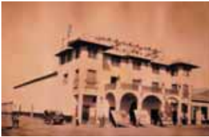
Chacabuco Theater , c.1929.

The Theater and Library (3) , a large 750 square meters building, remarkable for its height and construction, could hold an au-