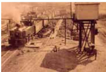
Unloading of caliche into the Buzón for crushing.

On the North side of the cachuchos was the area of the clarifiers or chulladores . These were iron tanks where the broth was clarified through decantation. The se-