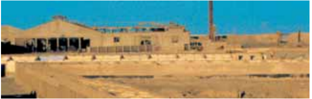
Single worker’s quarters on the West and South end of Chacabuco.

two blocks of houses separate by 3 meters-wide passages.