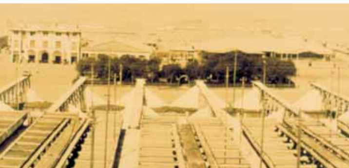
Crystallization troughs, drying bays and main square of the Chacabuco Nitrate Office, c. 1930.

and cleaning of the office in order to transform it into both a site museum and a research and record center.