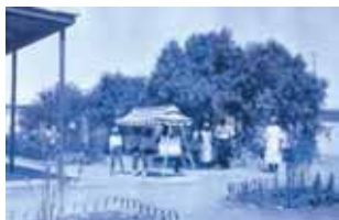
Patio de Hospital de Oficina Salitrera

Regrese a la señal N° 2 Prisioneros Políticos. Al Este, al final de esta calle llamada Antofagasta, se localizaban el Hospital y Maternidad (4) de la Ex Oficina Salitrera, dependencias utilizadas como hospital militar durante la permanencia de los prisioneros políticos.