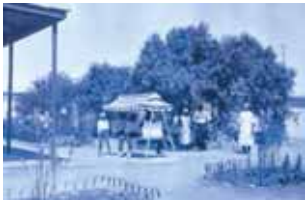
Patio of the Nitrate Office’s Hospital.

conduct the prisoner’s relations with the military. The Council was in charge of deciding important matters regarding the well being of the prisoners and of making proposals for the smooth operation of the Political Prisoner’s Camp. The Health Center, run by imprisoned doctors, provided medical and dental assistance to all the prisoners and, more than once, to the military in charge of their custody.