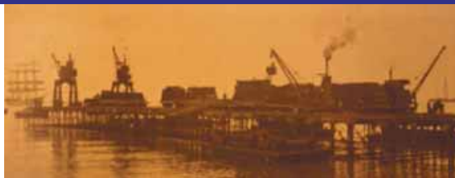
Muelle Salitrero del Puerto de Mejillones.