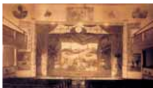
Boca del Teatro de Chacabuco, c. 1929.