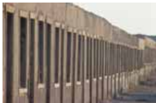
Cuartos de Solteros.

Dirigiéndose hacia el Oeste por calle Coquimbo hasta el final, llegará a las viviendas de cierre y encontrará una de las puertas de acceso de la Ex Oficina Salitrera —actualmente tapiada— denominadas trancas. Las viviendas de cie-