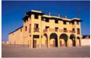
The restored Chacabuco Theater, 1992.