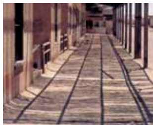
A corridor of the Pulpería (General Store).

was supplied by train and had its own special platform on its West façade for unloading provisions and materials. The Pulpería sold groceries, bread, meat, coal and fabrics, and provided the Nitrate Office's workers with all sorts of products. In addition, it was authorized to allow the daily ac-