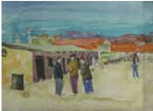
Drawing by Adam Policzer, former Chacabuco political prisoner, made while imprisoned.

August 19, 1927 / BREAD DELIVERYMEN: “The two bread deliverymen have been repeatedly told not to leave the animals beside the bread carts because the said animals relieve themselves near the bread baskets. However, these men