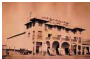
Teatro de Chacabuco, c. 1929.

El Teatro y Biblioteca (3) , gran edificio de 750 metros cuadrados que destaca por su altura y construcción, tenía capacidad para 1.200 espectadores (700 en gale-