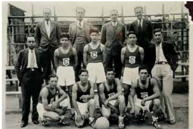
Chacabuco Basketball team, c.1930.

In front, on the East sidewalk and on the corner with Atacama Street, stood the Laundry and Gymnasium (6) . The latter, with a wooden floor, included a Boxing ring and was used by the political prisoners as a workshop