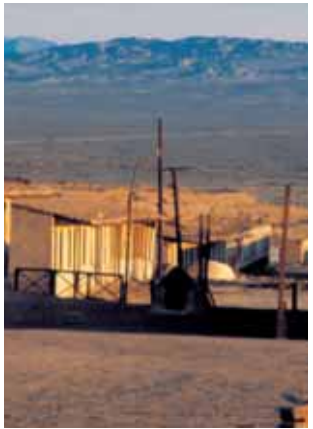
Street of the Chacabuco Worker’s Camp.

Returning to sign # 4 “Worker’s Camp” and walking South along Aldea Street, on the Southeast corner of Aldea and Aconcagua Streets stood the Market (7) and, diagonally opposite it, on the Northeast corner, a branch of the Pulpería (General Store), whose façade still shows some original wall paintings.