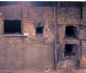
Ovens of the Chacabuco Bakery.

Walking further towards the East along Valparaiso Avenue, between the Pulpería on your right and the Theater on your left, you arrive at the Southwest corner of the Main Square where there is sign