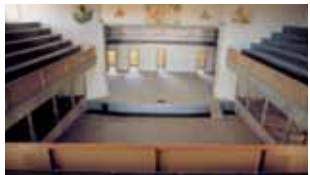
Chacabuco Theater at present.

The Main Square (0) is a perfect 50 x 50 square meters, standing within a 100 x 100 meters area. The square constituted the core of the Nitrate Office and was conceived as a green area for recreational and social meeting purposes. A gazebo stood in the middle