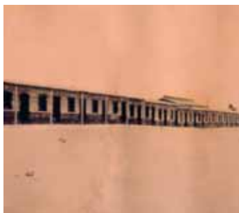
Calle del Campamento Obrero, c.1930.

La oficina de Bienestar Social se ocupaba del cumplimiento de las Leyes Sociales , que incluían: sociabilidad, deportes y entretenimientos, sociedades mutualistas, ahorros, servicio de registro civil,