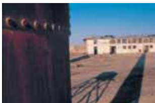
The Chimney and, on the background, the Workshops.

try's most exhausting works was the extraction of caliche , the nitrate raw material. This task was performed in the middle of the pampas by the particulares (small-scale prospectors), who wore clothes made of white cotton flour sacks called "cotonas".