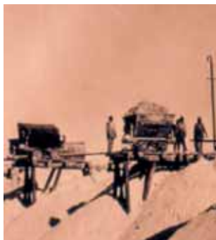
Nitrate drying field.

In order to extinguish fires in the nitrate fields, workers were instructed to use only "old waters", that is, the water which had already been used in the nitrate elaboration process and which still contained some amount of minerals. Any other kind of water only increased combustion.