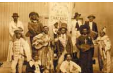
Masquerade at Coya Office ,1913.

Among other things, this growth translated into the development of the so-called Pampas Culture , whose traditions remain very much alive and present up to this day. The origin of this culture can be found in the trades generated by the industry, the special language born from the different types of work, and the social life