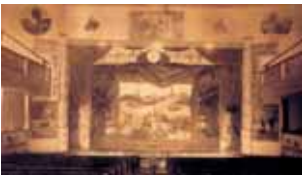
Chacabuco Theater's entrance, c.1929.