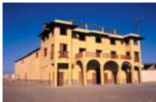
Teatro de Chacabuco restaurado en 1992.