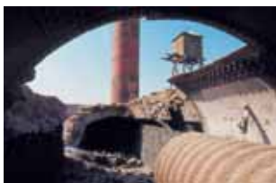
Boilers tunnel and part of the chimney.

Now return to the "Buzón" and climb up to the Plant, a high mound where you can still appreciate the pillars which supported the BOILING CACHUCHOS .