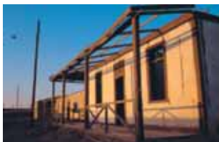
Actual fachada del Hospital de Chacabuco.

En la acera de enfrente en la esquina Noreste ubicaron, de Norte a Sur, la Escuela y la Biblioteca. La Escuela se constituyó en un centro de formación con una amplia gama de cursos a cargo de profesores y académicos prisioneros. Esto posibilitó la adquisición de conocimientos a prisioneros que no habían podido terminar sus estudios y, también, a aquellos que, habiéndolos concluido, querían incursionar en nuevas áreas. A su vez, la Biblioteca instalada sobre la litera de una de las habitaciones, reu-