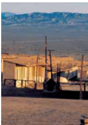
Calle del Campamento Obrero de Chacabuco.

Regresando a la señal N° 4 Campamento Obrero y caminando hacia el Sur por Calle Aldea, en la esquina Suroeste de Aldea con Aconcagua se encontraba el Mercado (7) y, en diagonal a éste, esquina Noreste, la Sucursal de la Pulpería, cuya fachada aún con-