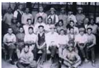
Manager, employees and workers of the Bellavista Office.

times, for a long time it was considered only as a raw material for the manufacture of gunpowder.