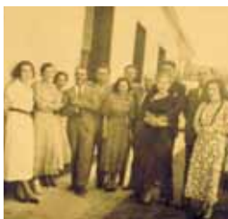
Empleados Superiores de Chacabuco en el "Rancho", c.1930.

planta, terraplén en altura donde aún permanecen las columnas que soportaban los CACHUCHOS de ebullición.