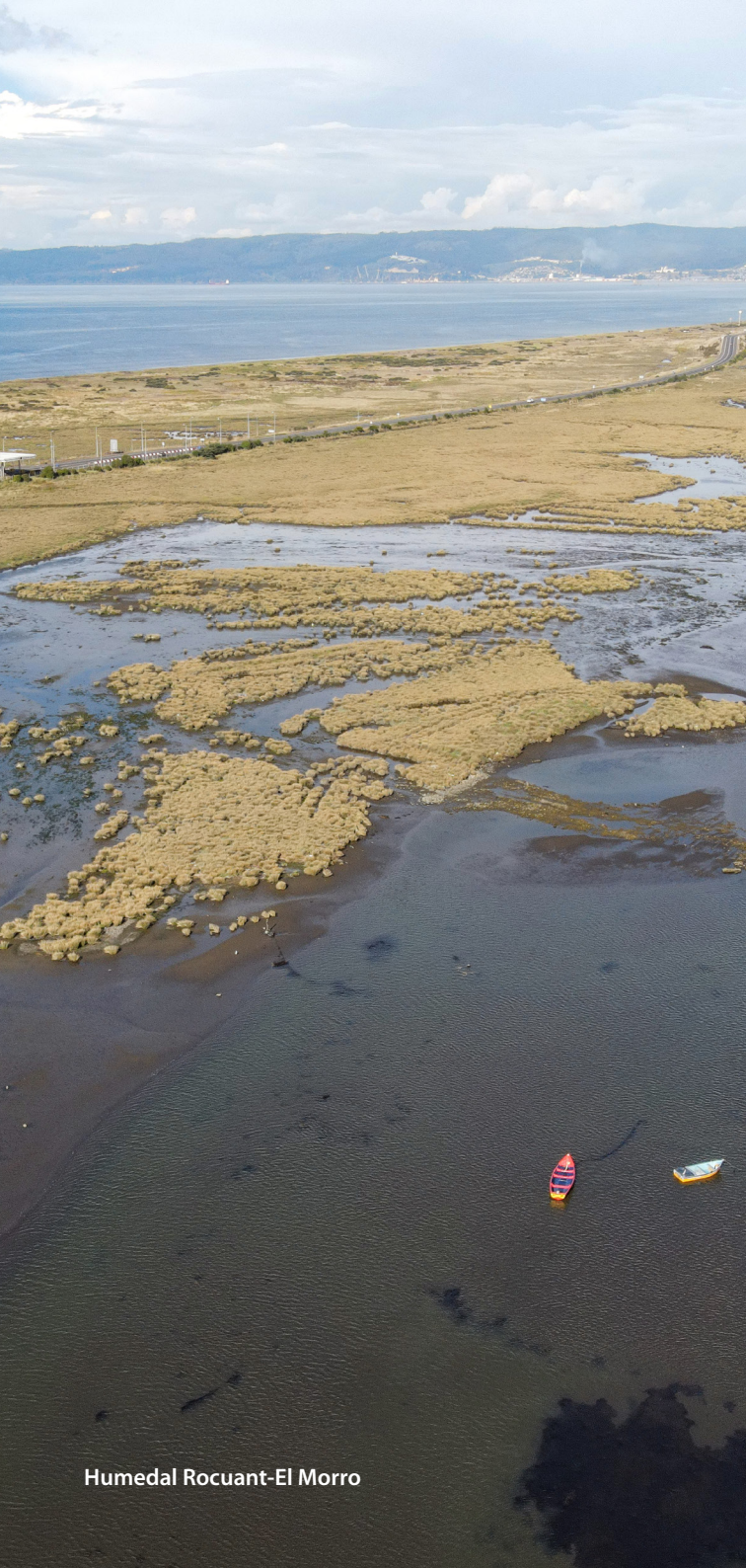
Humedal Rocuant-El Morro